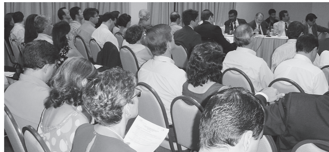
Uma das sessões do III Encontro sobre Acessibilidade nos Transportes Públicos: Ampla participação nos debates.

Durante os debates desse tema, questionou-se o fato de o decreto não definir quais serão as fontes de recursos para financiamento, nos próximos dez anos, para os agentes públicos e privados que estão sendo obrigados a empreender modificações significativas em edifícios e sistemas de transporte.